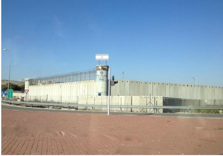
صورة لسجن "عوفر" العسكري

في ذات السياق، حجرت إدارة سجن "عوفر" أسيرين آخرين من الأسرى الأطفال الذين التقوا صرصور أثناء